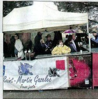
Une poignée de courageux a bravé la pluie pour les frites de la buvette.

Si la pluie a fait le vide autour de Grammont, hier, les 1 200 joueurs plus leurs accompagnateurs ont fait le plein, ailleurs. Certains ont choisi le samedi shopping au Polygone, les Canadiens de Saint-Hubert ont pris la direction des grottes des Demoiselles, d'autres celle du Sea-quarium, au Grau-du-Roi, ou du bowling d'Odysseus... Une belle contribution au tour-nisme régional, même dans la grisaille. C'est à noter !